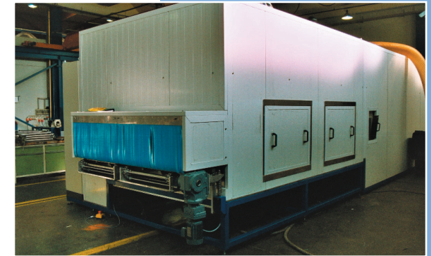
Auslaufbereich mit Schallschutz nach dem Trocknen

Dies ist bei einer Anlagenlänge von unter 12 m nur mit der von MTM entwickelten Anlagentechnik möglich!