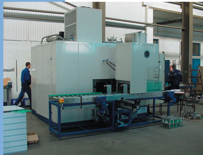
MTM-Einkammeranlage ERA 160: vielseitige Reinigungstechnik auf kleiner Stellfläche (10 m 2 )